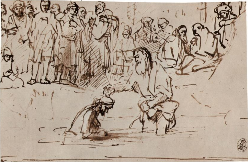
Rembrandt: Taufe Christi

Jesus selber liess sich von Johannes im Jordan taufen. Dieses Ereignis und die Worte von Jesus führten dazu, dass die Taufe seit den ersten Anfängen der Kirche praktiziert wurde.