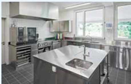
Der Felsenhofsaal mit oder ohne Küche