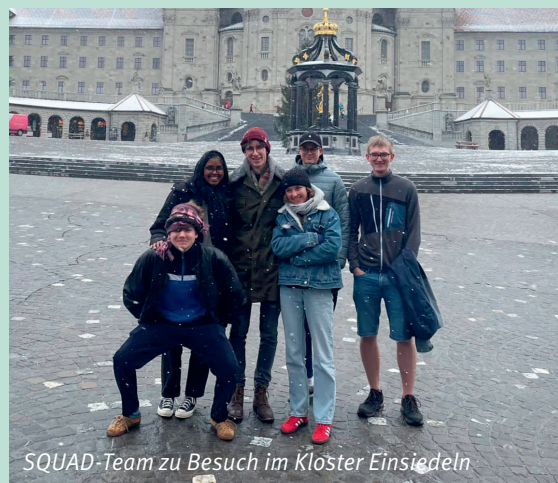
SQUAD-Team zu Besuch im Kloster Einsiedeln